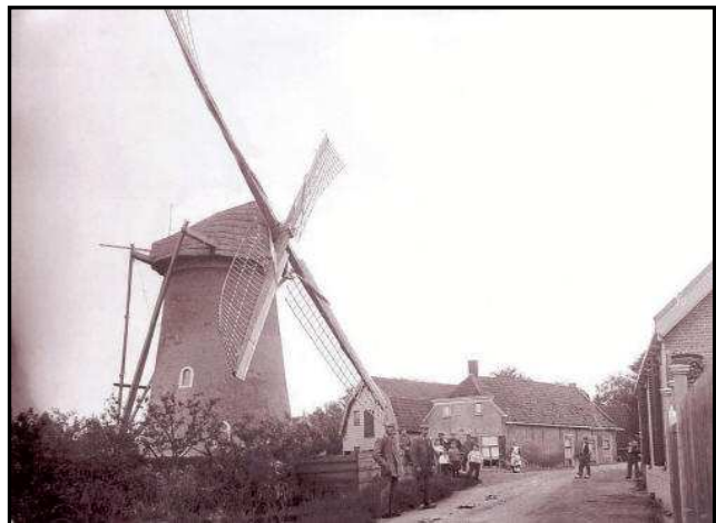
De korenmolen "De Leemolen" aan de Leeweg in de Lier. (opgeblazen in de 2e