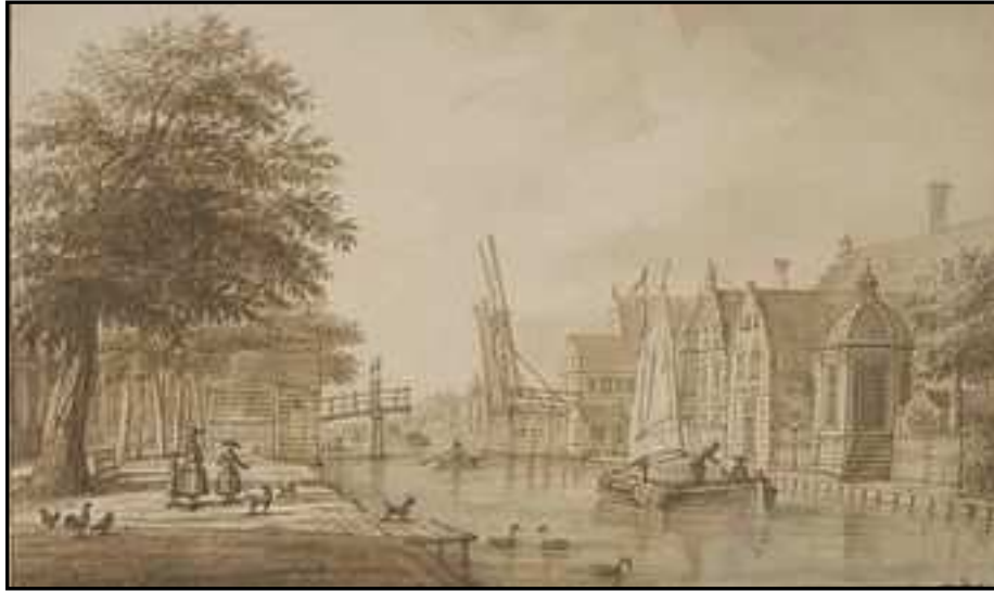
Sepiatekening uit 1760 van P.C. de la Farge