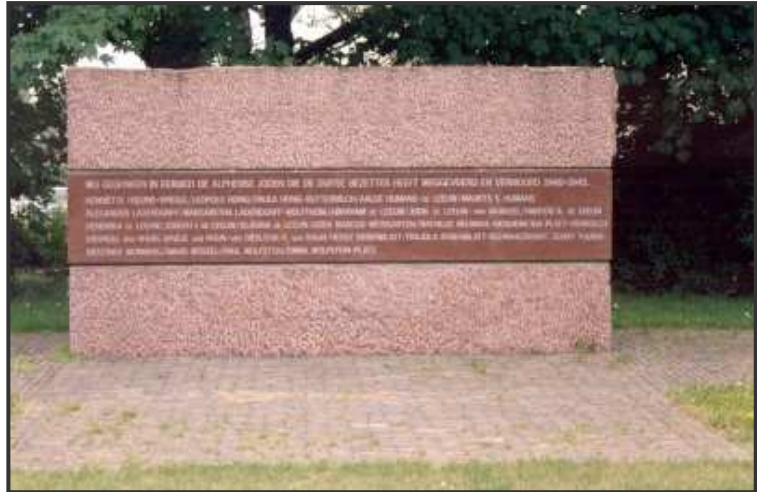
Het Joods Monument in Alphen a/d Rijn met de namen van de joodse slachtoffers, ook die van nr 5 en nr.11